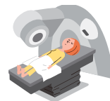
病気で放射線治療を受けたとき