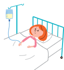
病気で入院したとき、病気で手術したとき 病気で入院後通院したとき