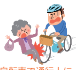
自転車で通行人にケガをさせた

※ご家族も被保険者となります。 被保険者の範囲は引受保険会社ホームページに掲載しているパンフレット別冊の「契約概要のご説明」の「1. (1) 商品の仕組み」をご参照ください。